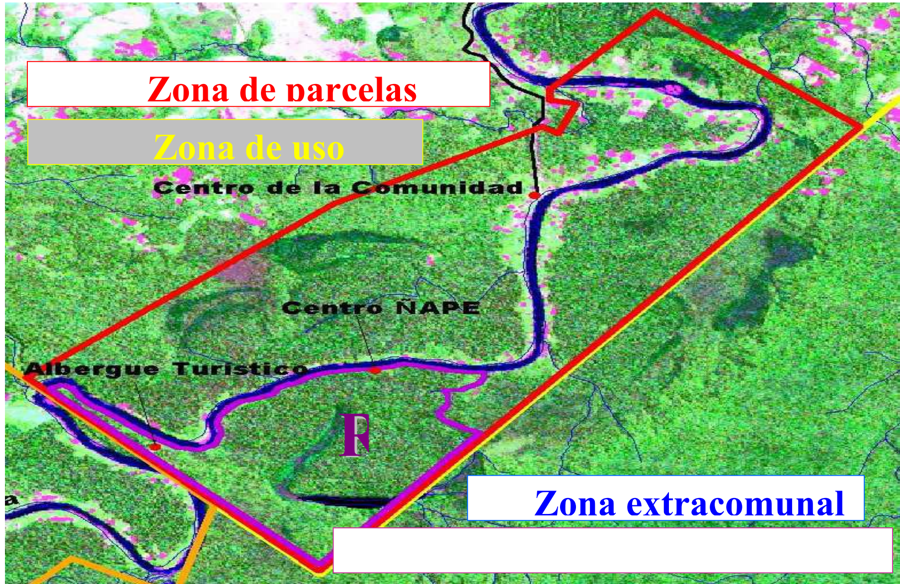
Mapa 2. Zonas de uso de recurso naturales de la Comunidad Nativa de Infierno