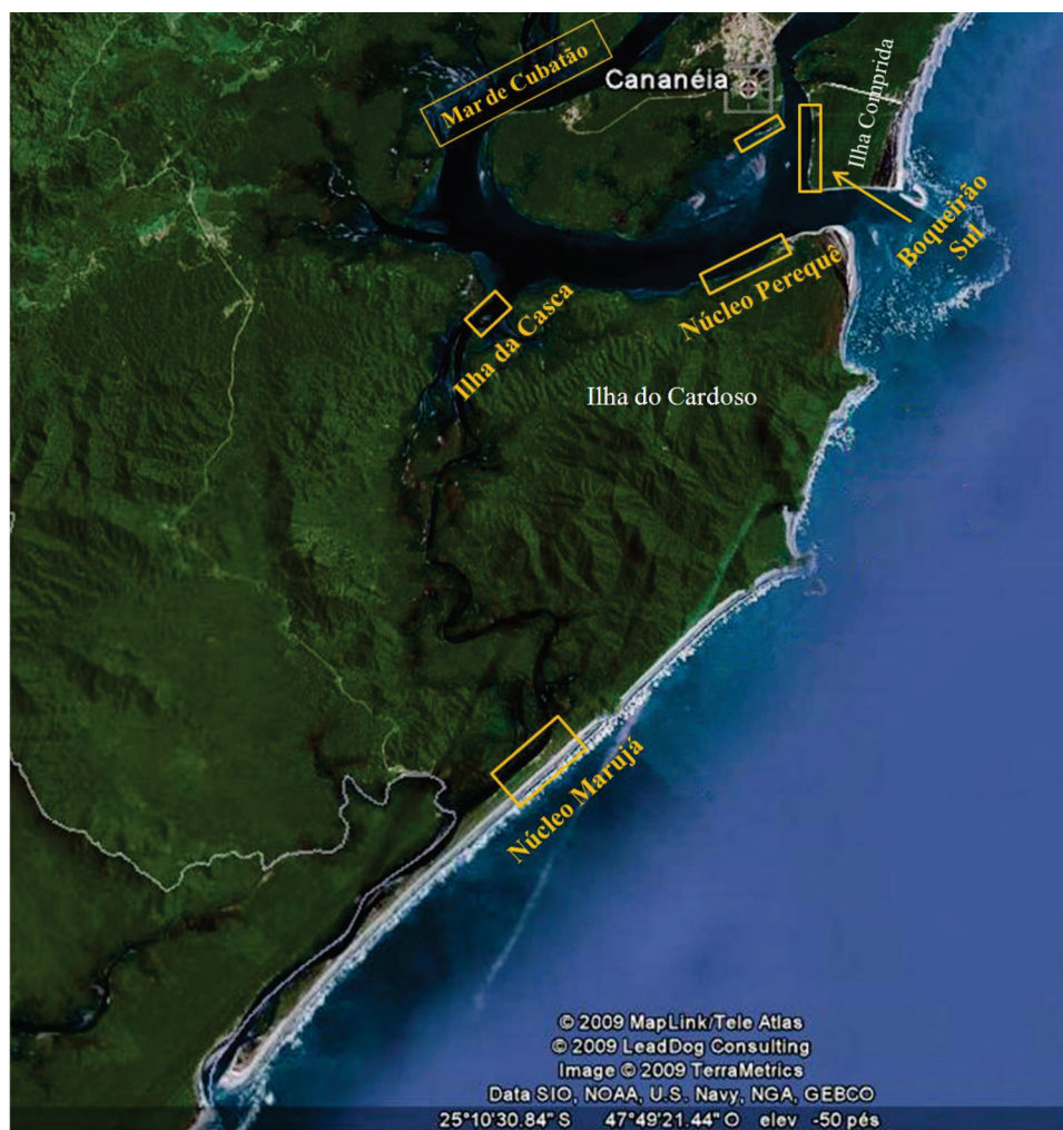
FIGURA 3: Localização das áreas onde os entrevistados construíram os cercos-fixos: Ilha da Casca Núcleo Marujá, Núcleo Perequê, Boqueirão Sul e Cananéia.

Além disso, foi possível observar também que 38% dos pescadores diminuem o esforço de pesca na época de verão e assumem atividades voltadas para o turismo na região. Tal situação de enfraquecimento da pesca artesanal devido ao surgimento de outras possibilidades de trabalho mais rentáveis, principalmente atividades econômicas ligadas ao turismo local, é igualmente relatada por Cardoso (2004) em seu trabalho realizado na Ilha do Cardoso e por Diegues (2004) em outras localidades do litoral do estado de São Paulo.