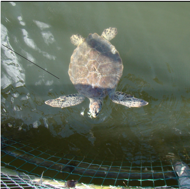
FIGURA 5: Tartaruga verde ( Chelonia mydas ) capturada por um cerco-fixo localizado na Ilha do Cardoso.

Devido à falta de trabalhos sobre essa temática na região estudada, os dados da Tabela 2 são as únicas informações a serem comparadas com os dados etnobiológicos obtidos pelo presente estudo. É necessário ressaltar que o monitoramento das praias e o acompanhamento das atividades pesqueiras não foram realizados de forma contínua, dependendo da disponibilidade dos pesquisadores, das condições climáticas e da colaboração dos pescadores.