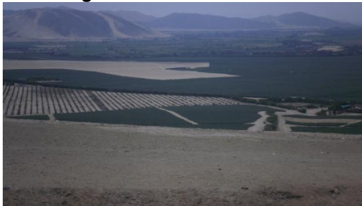
Figura 5 – Zonas de cultivo

Las figuras 5 y 6 muestran los cultivos en una zona desértica y la canalización de las aguas del río Santa.