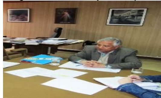
Figura 3 - Tercer trabajo de campo

El cuarto trabajo de campo permitió concluir la primera etapa del cuestionario; y se establecieron las pautas para la sostenibilidad de la investigación con la organización de talleres de asociatividad en el valle de Virú.