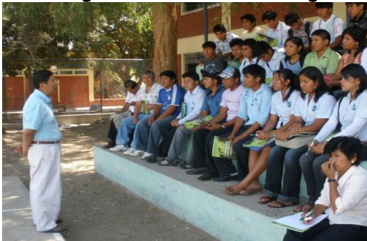
Figura 15 – Taller de liderazgo

Los resultados del segundo taller confirmaron la hipótesis general de la investigación: el desarrollo de las pequeñas unidades agrícolas se logra con la integración de los actores para lograr la competitividad y el desarrollo sostenible del valle.