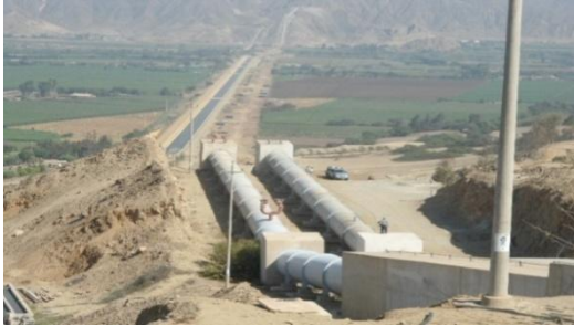
Figura 8 - Generación y transporte de agua potable

El 26 de marzo se realizaron visitas a las instalaciones del proyecto especial Chavimochic; la figura 8 muestra su aporte en el desarrollo del recurso hídrico y la figura 9 muestra el desarrollo agroindustrial de los últimos años.