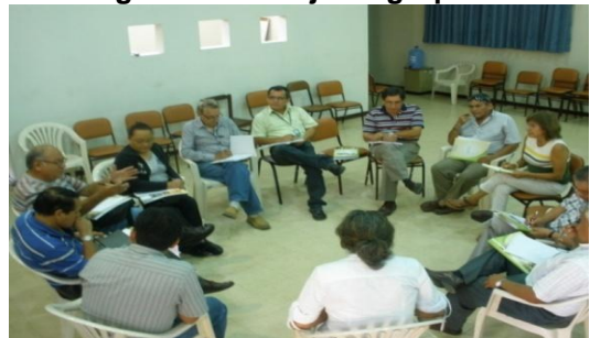
Figura 7 - Trabajo en grupos