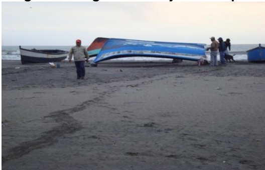
Figura 2 - Segundo trabajo de campo

La figura 2 muestra dos espacios de desarrollo no tradicional, el puente Virú y el puerto Morín. El cuestionario, en su primera aplicación, sirvió para validar los resultados previos y obtener la opinión de los expertos.