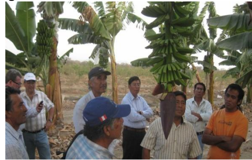
Figura 13 – Visitas a las zonas de cultivo

El día 03 de noviembre se realizaron reuniones con los representantes de las instituciones auspiciadoras, visitas a las instalaciones del Proyecto especial Olmos Tinajones y al Fundo experimental Pasabar con dirigentes del valle viejo de Olmos (figura 13)