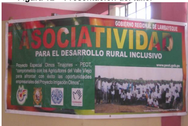
Figura 12 – Presentación del taller