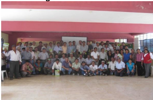
Figura 16 – Charla final

Los talleres, figura 16, generaron espacios de diálogo entre los actores (sector público, privado y académico) para lograr el desarrollo sostenible en base al consenso y la construcción de un entorno basado en la equidad y la asociatividad.