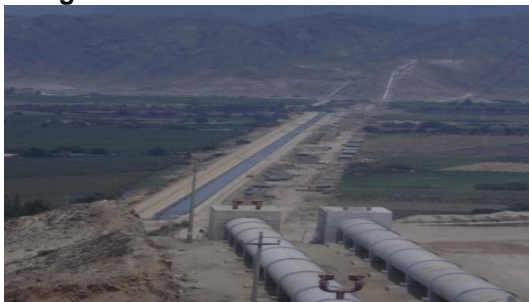
Figura 6 – Canalización del río Santa