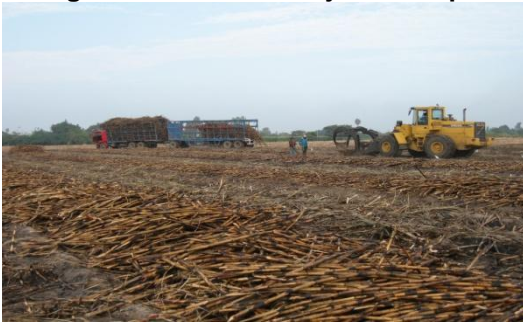
Figura 1 - Primer trabajo de campo