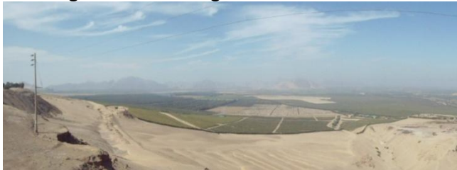
Figura 9 - Tierras ganadas al desierto