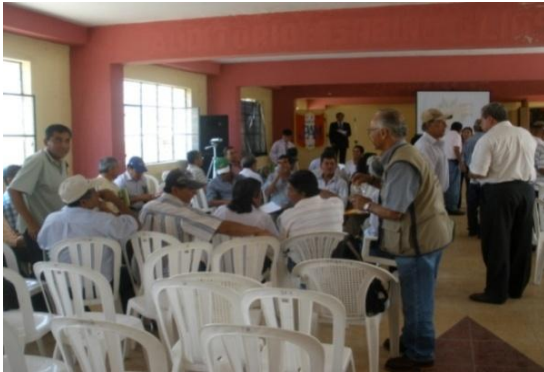
Figura 14 – Taller participativo