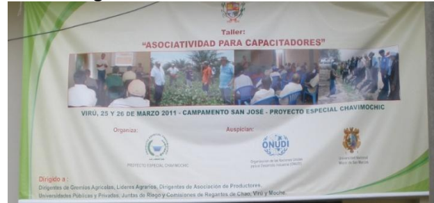
Figura 6 - Presentación del taller